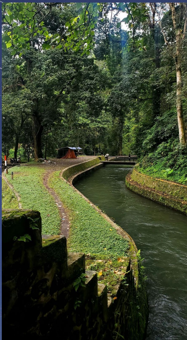
DAM SANTONG - LOMBOK UTARA

Pantai Alang-alang merupakan salah satu pemukiman di Pulau Lombok yang memiliki padang lamun yang kondisinya masih baik. Ekosistem padang lamun merupakan ekosistem yang cukup kompleks dengan segala fungsi yang penting terhadap ekosistem pesisir. Lamun merupakan tumbuhan tingkat tinggi yang hidup dan terbenam di lingkungan laut; berpembuluh, berdaun, berimpang (rhizome), berakar dan berkembangbiak secara generatif (biji) dan vegetatif (tunas).