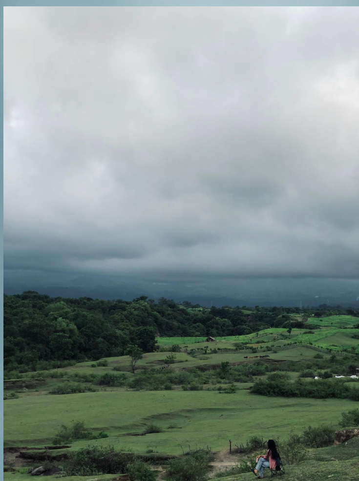
LOLOAN - BAYAN LOMBOK UTARA

Lombok Utara - Kekayaan alam hutan adat di Desa Santong Kecamatan Kayangan Lombok Utara, NTB merupakan berkah yang tiada tara. Hutan adat yang terletak di ujung desa memiliki sedikitnya 30 air terjun yang ciamik dan menawan. Bahkan, warga desa acap kali menyebut seluruh air terjun yang berada di Desa Santong sebagai sumber kehidupan masyarakat setempat. Air Terjun atau "Tiu" dalam bahasa khas suku Sasak bagian Lombok Utara memiliki beragam fungsi bagi kehidupan warga, baik sebagai sumber air konsumsi, persawahan dan sektor pariwisata.